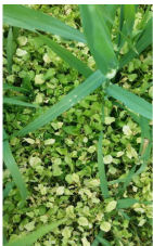
7 päeva pärast pritsimist