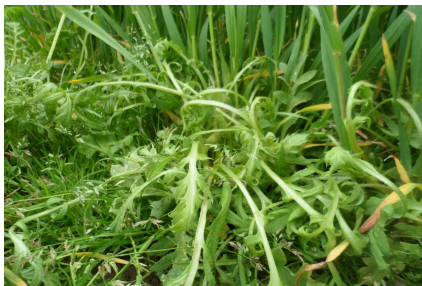
Pixxaro™ EC efektiivsus maguna tõrjel